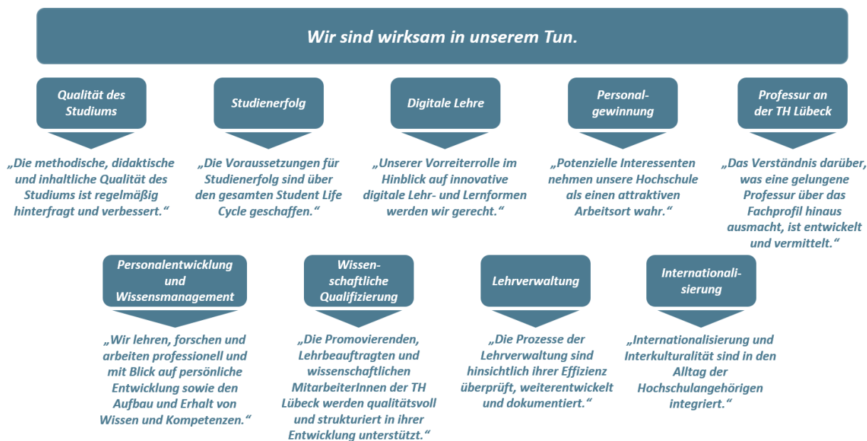
Grafik 6: Qualitätsversprechen der TH Lübeck

Ein wichtiger Faktor bei der Gewinnung von Studierenden und MitarbeiterInnen gleichermaßen ist die Internationalisierung – vorangetrieben durch den stark vernetzten Arbeitsmarkt sowie durch die steigende Notwendigkeit, dass sich ExpertInnen weltweit zu Forschungsthemen austauschen und zusammenarbeiten.