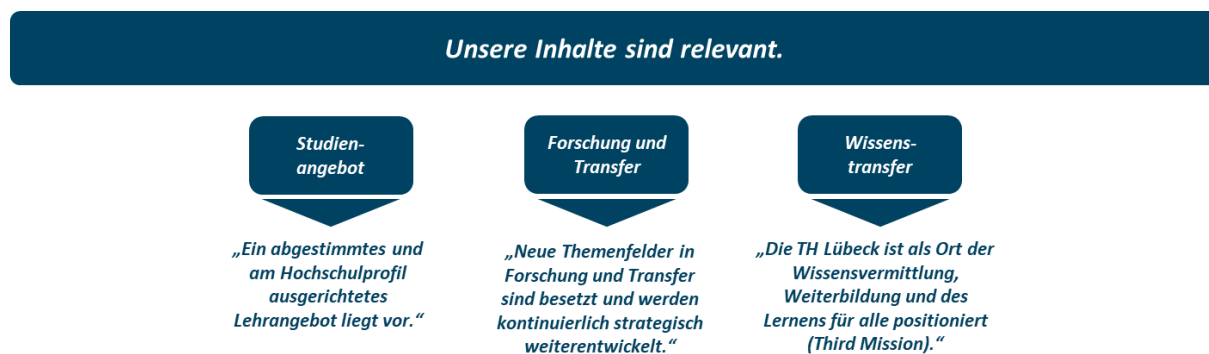
Grafik 5: Inhaltsversprechen der TH Lübeck

Zudem wollen wir die Wahrnehmung der TH Lübeck als Ort des Erkenntnisgewinns stärken, indem gewonnene Erkenntnisse verstärkt und konzertiert in die Gesellschaft kommuniziert werden. Die Kommunikation mit der Gesellschaft (und deren Resonanz) zahlt gleichzeitig auf die Sicherstellung der Relevanz unserer Forschungs- und Lehrthemen ein.