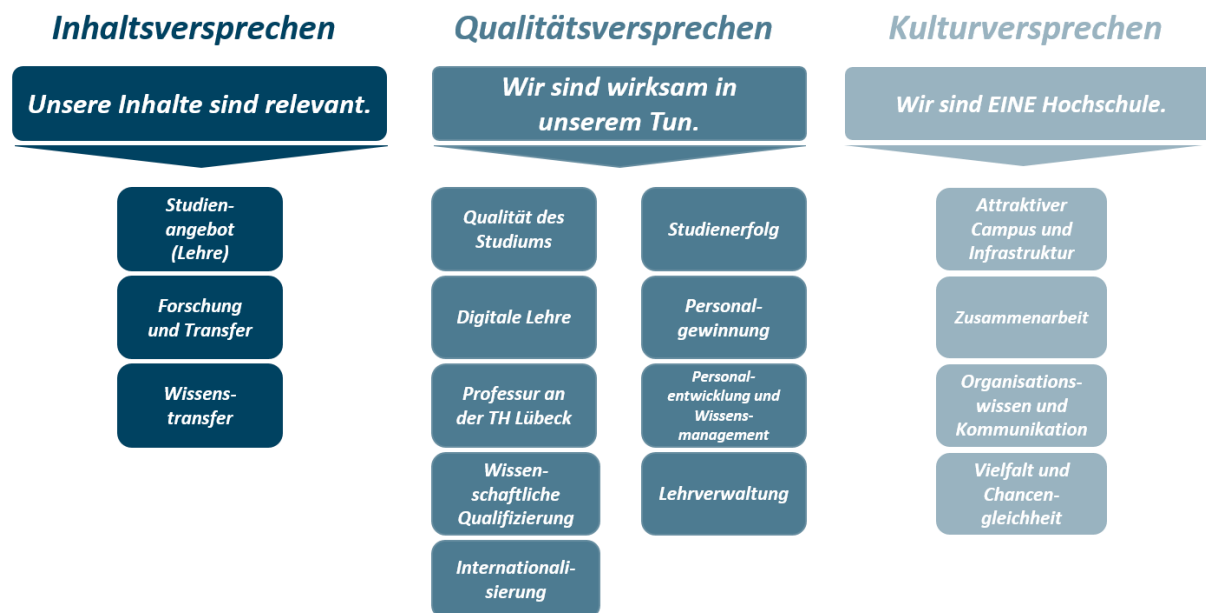
Grafik 4: Kernversprechen und Handlungsfelder

Für die Umsetzung der Hochschulstrategie und zur Erfüllung der Versprechen wurden Handlungsfelder identifiziert und definiert. Diese Handlungsfelder sind Aufgaben, die unsere Hochschule in den nächsten Jahren in den Fokus stellt und somit Themen bearbeitet, die für unsere zukünftige Ausrichtung und Weiterentwicklung wichtig sind. Dies schließt ausdrücklich nicht das Bearbeiten weiterer wichtiger – an dieser Stelle nicht explizit benannter – Themenfelder aus. Neben den Entwicklungen und Fortschritten in den Handlungsfeldern selbst wird ein Mehrwert insbesondere in der Verzahnung der Handlungsfelder untereinander gesehen.