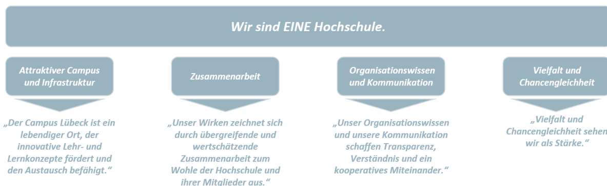
Grafik 7: Kulturversprechen der TH Lübeck

Vielfalt und Chancengleichheit werden in Lehre, Forschung und Transfer gleichermaßen weiterentwickelt. Um gesellschaftlichen Herausforderungen adäquat zu begegnen und innovative Lösungen zu finden, sind sie unabdingbar. Aktuell sind jedoch verschiedene Gruppen an der Hochschule unterrepräsentiert. Dies soll durch die Operationalisierung des Handlungsfeldes verringert werden.